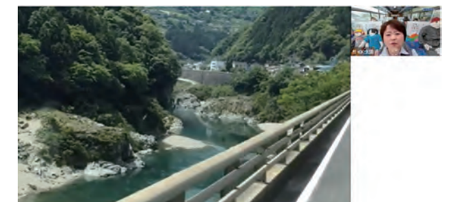
オンラインバスツアーでの沿道景観の例

新型コロナ危機の影響で地方の観光業の収益が低迷する中、地域密着型のバス会社が先駆的にオンラインバスツアーに取り組んだことにより、自社や観光地の売上・集客確保に加え、多数のメディア報道を通じて、打開策を模索する全国の観光事業者に新規事業の可能性を示し、地方創生・地域活性化に貢献している。