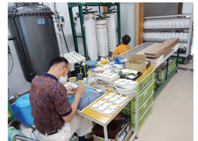
就労支援施設で定番商品の加工を行うスタッフ