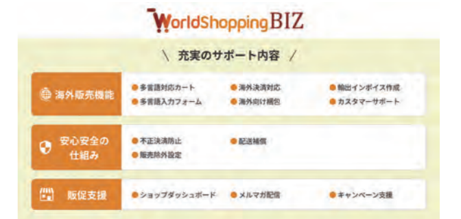
「WorldShopping BIZ」でのサポートメニューの一覧

海外からの注文客に対する言語、決済、配送などの対応を外部化できるサービスであり、ショップは国内顧客と同じ対応をするだけで済む。海外への販売を強化したいと考える事業者にとって役立ち、日本の EC 事業のグローバル化に貢献できるサービスである。