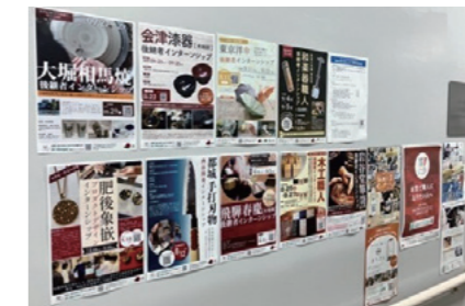
職人を志す学生が通う全国のものづくり系の150以上の学校に告知ポスターを掲示