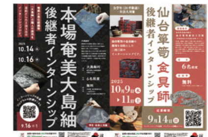
後継者インターンシップの例

インターンシップで誕生した後継者の定着率は78.9% (2026年3月現在)。内定者に対して移住のハードルを下げ、後継者として末長く生活してもらうため、今後の生活を見据えたフォローアップを充実する。具体的には、住居