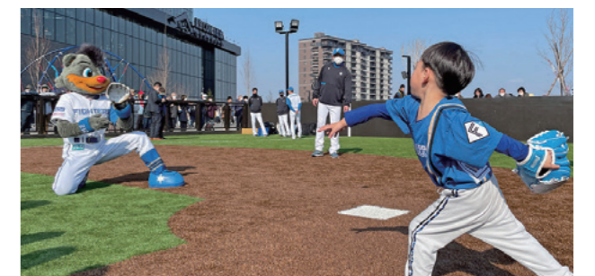
ミニフィールドでは、ボール遊びなどを楽しめる