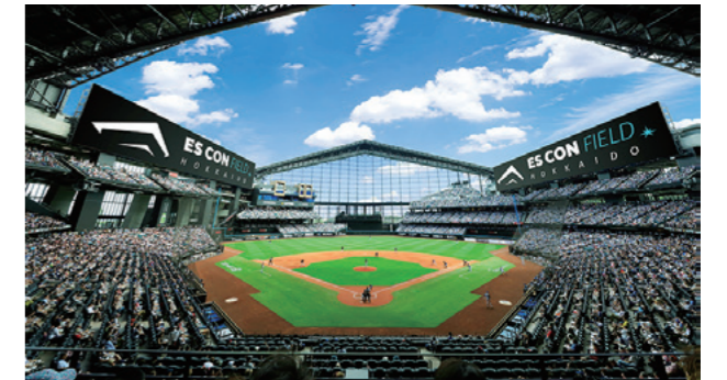
エスコフィールド HOKKAIDO の内観