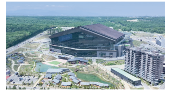
北海道ボールパークFビレッジの外観

道内外の多くのパートナー企業と理念を共有しつつ、革新的なボールパークという「スポーツの価値」と「北海道の価値」を融合させた、行楽地化と街化をかけた新しい街づくりのモデルを創造し続けている。