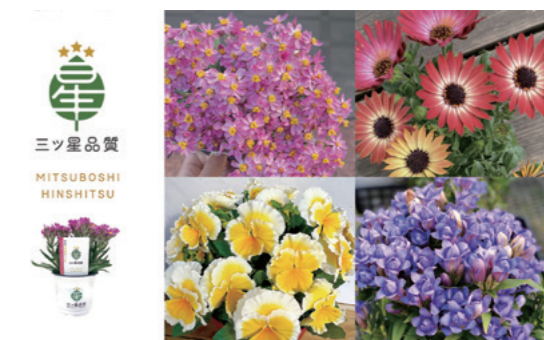
消費者の視点を取り入れて開発した独自ブランド「三ツ星品質」の商品例