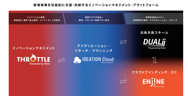
新規事業開発のプロセス全体を一気通貫で支援

④事業化の検証から商用運用までを代行・包括支援 サービス名は、DUALii (デュアリー)。新規事業の仮説検証から商用化までに必要とされる事業運営・保守管理・顧客対応などの一連のプロセスを代行する。社内実施におけるリソース不足や投資リスク等のハードルを解消し、社会実装を加速。