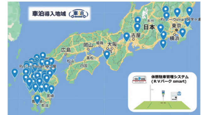
九州を中心に導入が進む(2025年1月現在)