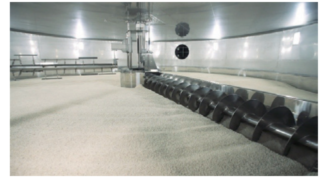
代表的な装置である回転式自動製麹装置の内部

「共感」「多様性」「内発的動機」を構成要素とする人的資本経営を実践する。個人の5年間の成長ビジョンの策定などを通じて、社員一人ひとりが躍動できる環境を整える。DX 導入にあたってはも個々の実践による手ごたえを起点として会社全体への展開を進めている。