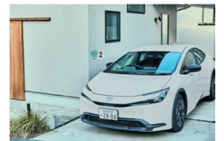
個人宅駐車場の活用例。アキッパのロゴが掲示されている