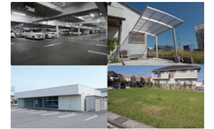
事業所や店舗の駐車場、個人宅の駐車場、有休未利用地など、バイク1台分のスペースがあれば貸し出し可能